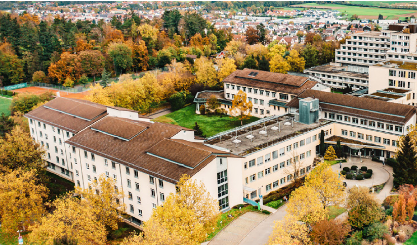
SRH Gesundheitszentrum Bad Wimpfen

Die Stadt Bad Wimpfen mit der größten Kaiserpfalz nördlich der Alpen lädt zu einem Bummel durch die historische Altstadt ein. Besteigen Sie den Blauen Turm, das Wahrzeichen der Stadt mit seiner über 650-jährigen Türmertradition, und genießen Sie einen herrlichen Ausblick auf das Neckartal und