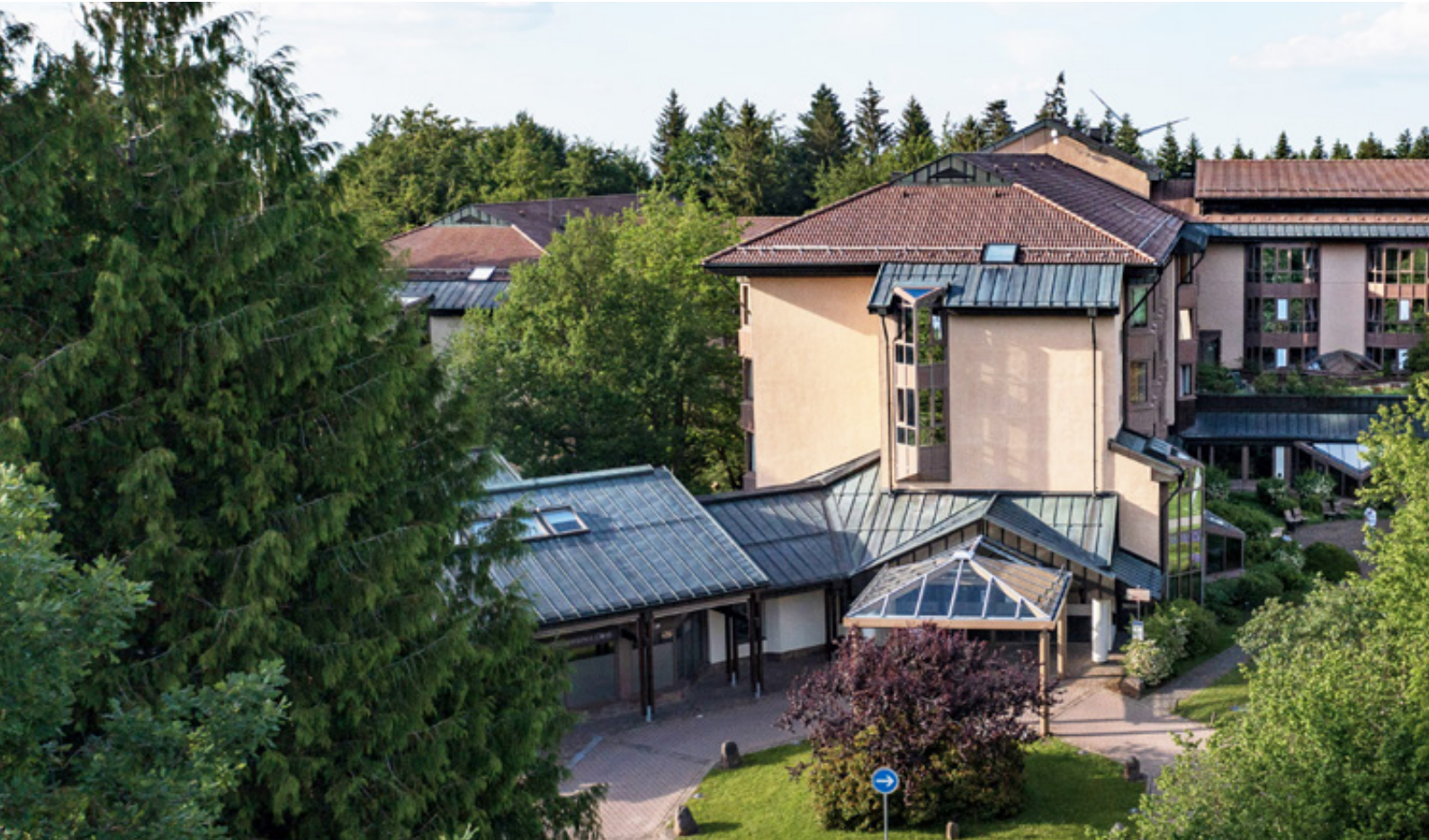
SRH Gesundheitszentrum Dobel

Zwischen Wald und Wiesen liegt unser SRH Gesundheitszentrum Dobel auf der heilklimatischen „Sonneninsel“ Dobel – der perfekte Ort für Outdoor-Therapien oder eine kurze Verschnaufpause in der Natur.