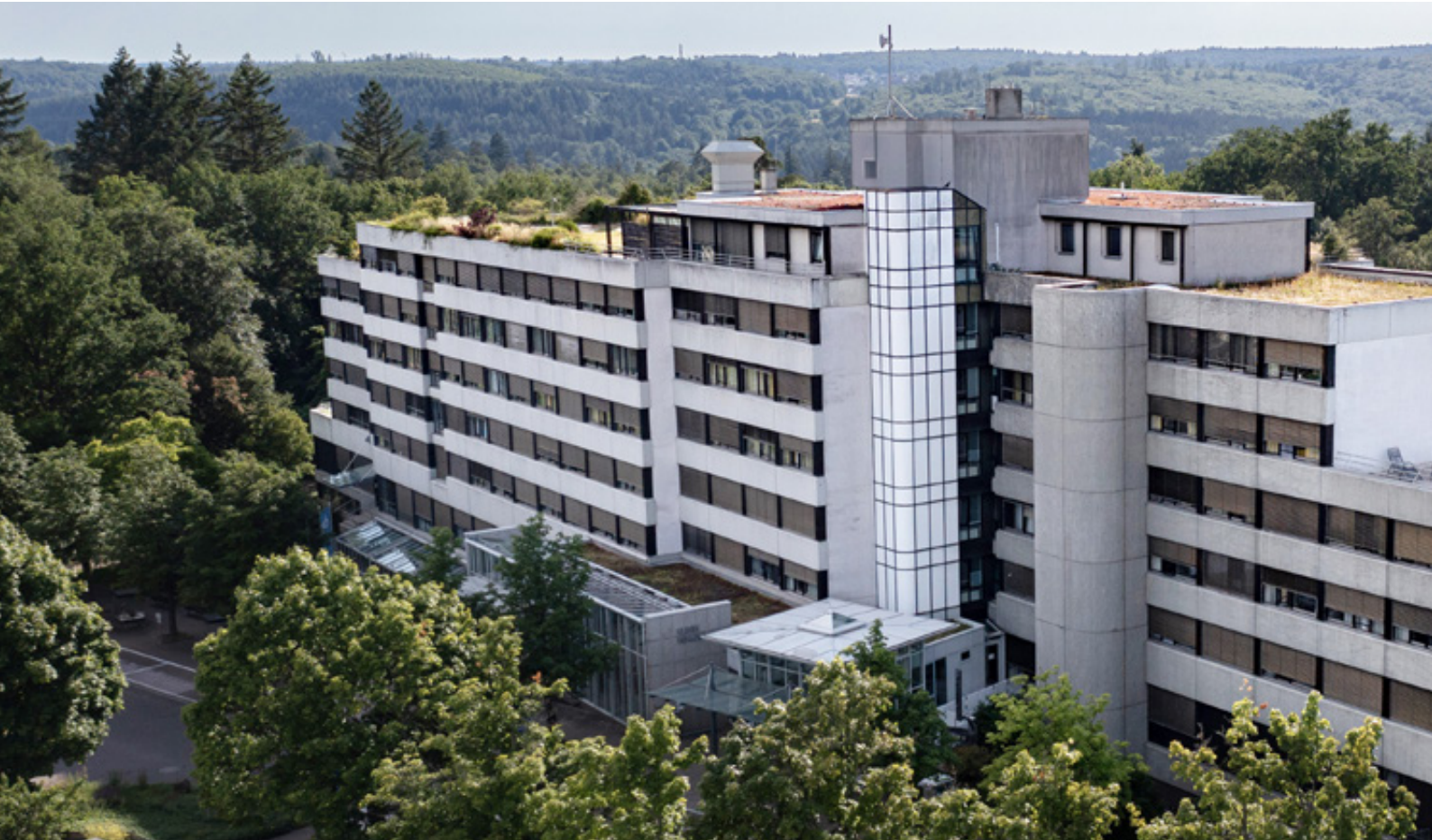
SRH Gesundheitszentrum Waldbronn

Das SRH Gesundheitszentrum Waldbronn liegt idyllisch am Waldrand und dennoch zentrumsnah. Alle wichtigen Orte für Unternehmungen außerhalb der Klinik sind in unmittelbarer Nähe gut zu erreichen. Die Albtherme liegt in circa 30 Metern Entfernung und sorgt für wohlige Entspannung.