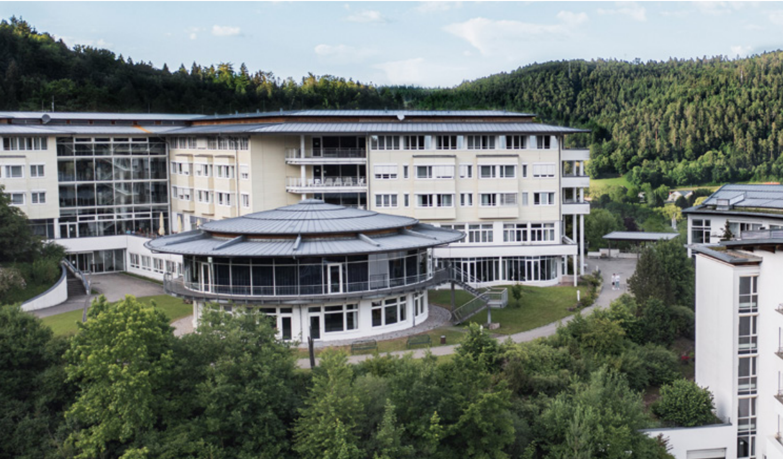
SRH Gesundheitszentrum Bad Herrenalb

Hoch über der Kurstadt Bad Herrenalb gelegen, wartet unser kompetentes Reha-Team auf Sie. Zwischen Kultur und Natur stärken wir Sie für Ihren Alltag.